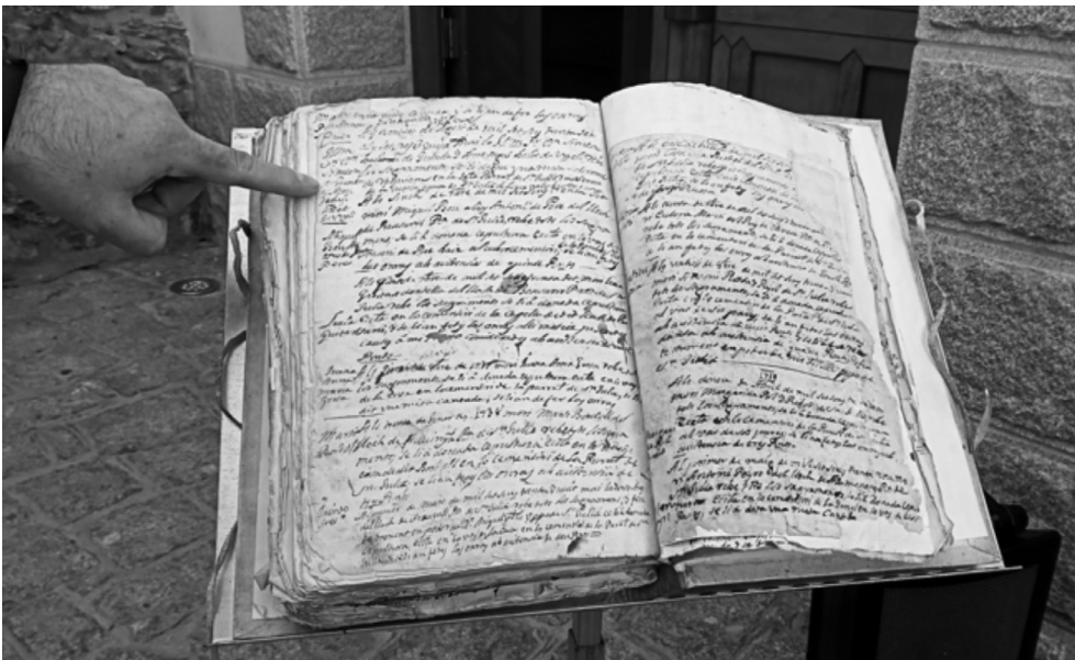
▶ Llibre d'òbits de Sant Julià de Lòria, pàgina on apareix l'acta de defunció del Bisbe de Guinda

El document també detalla que el Bisbe es trobava en visita pastoral als lauredians. No es va trobar bé per la nit, i va demanar l'administració dels últims sagraments. 4